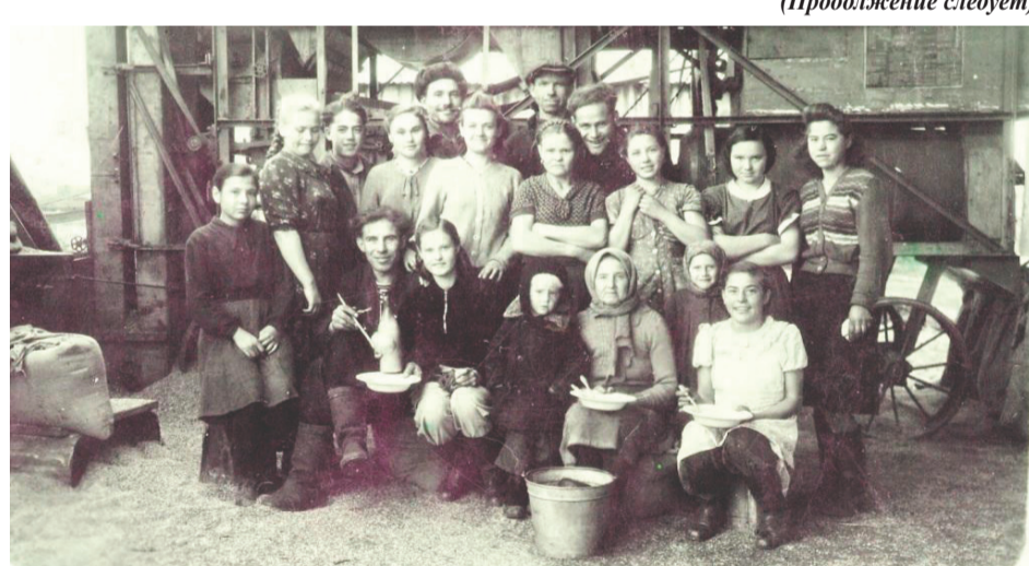
Рабочие колхоза имени Чапаева в хорошем настроении — к ним приехал фотограф