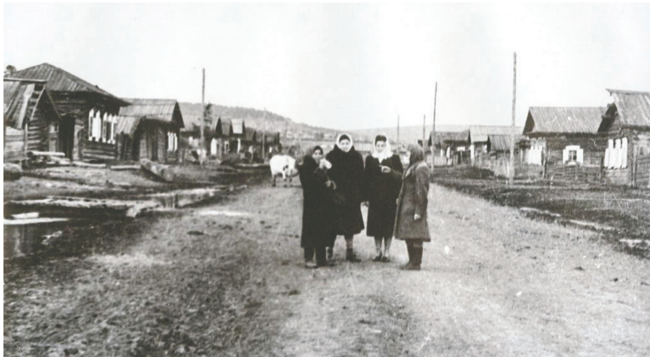
Улица Поеловская. Сейчас на этом месте толща воды в 43 метра

Краеведческие записки изучала Евгения Малеева (Продолжение следует)