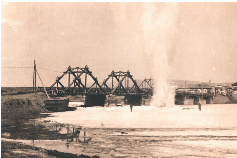
Взрывные работы у старого моста